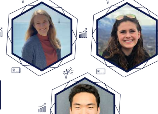
Jovenes Emprendedores Universidad de Boulder - USA